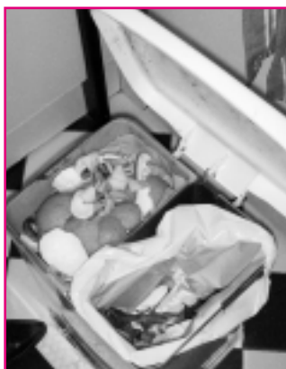
Mülleimer für organischen und gemischten Müll