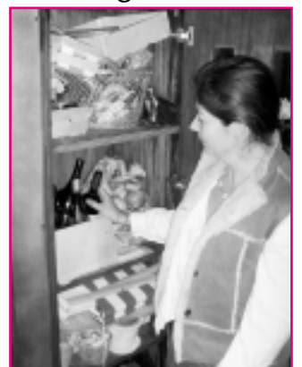
Glassammlung auf dem Balkon