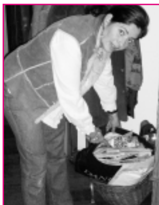
Papiersammlung im Flur