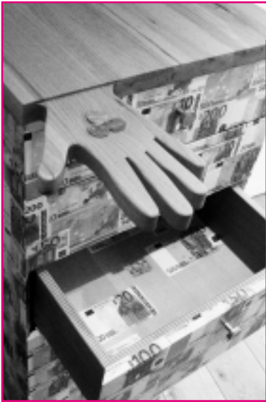
Die offene Hand aus Rütther's Holz

Der Reigen schließt sich, so soll es sein.