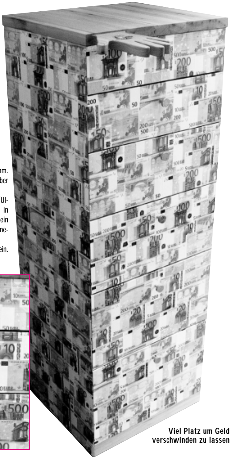
Viel Platz um Geld verschwinden zu lassen